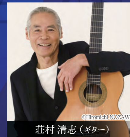
荘村 清志 (ギター)