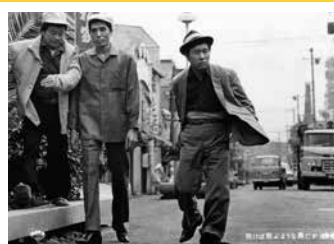
「吹けば飛ばぬ男だが」